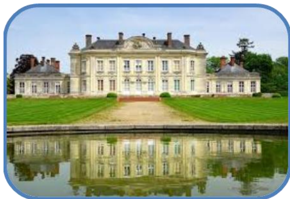
Son château du 18 ème siècle